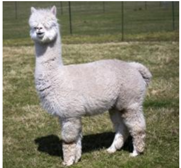
Die Aufnahme ist von Mai 2013

Im Sommer 2006 wurde uns in Chile ein zweijähriger Hengst mit einer Faser von 14 Micron angeboten. Es hat dann noch viele Umwege und 2 Jahre gedauert, bis er 2008 endlich zu uns auf den Hof kommen konnte.